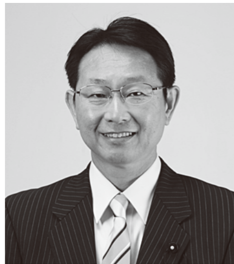
愛知県議会議員 (瀬戸市選出)

閉会日である10月14日には、民進党愛知県議員団として取りまとめた「平成29年度施策及び当初予算に対する提言」を、知事公館にて大村秀章知事に説明・提出いたしました。この提言は、会